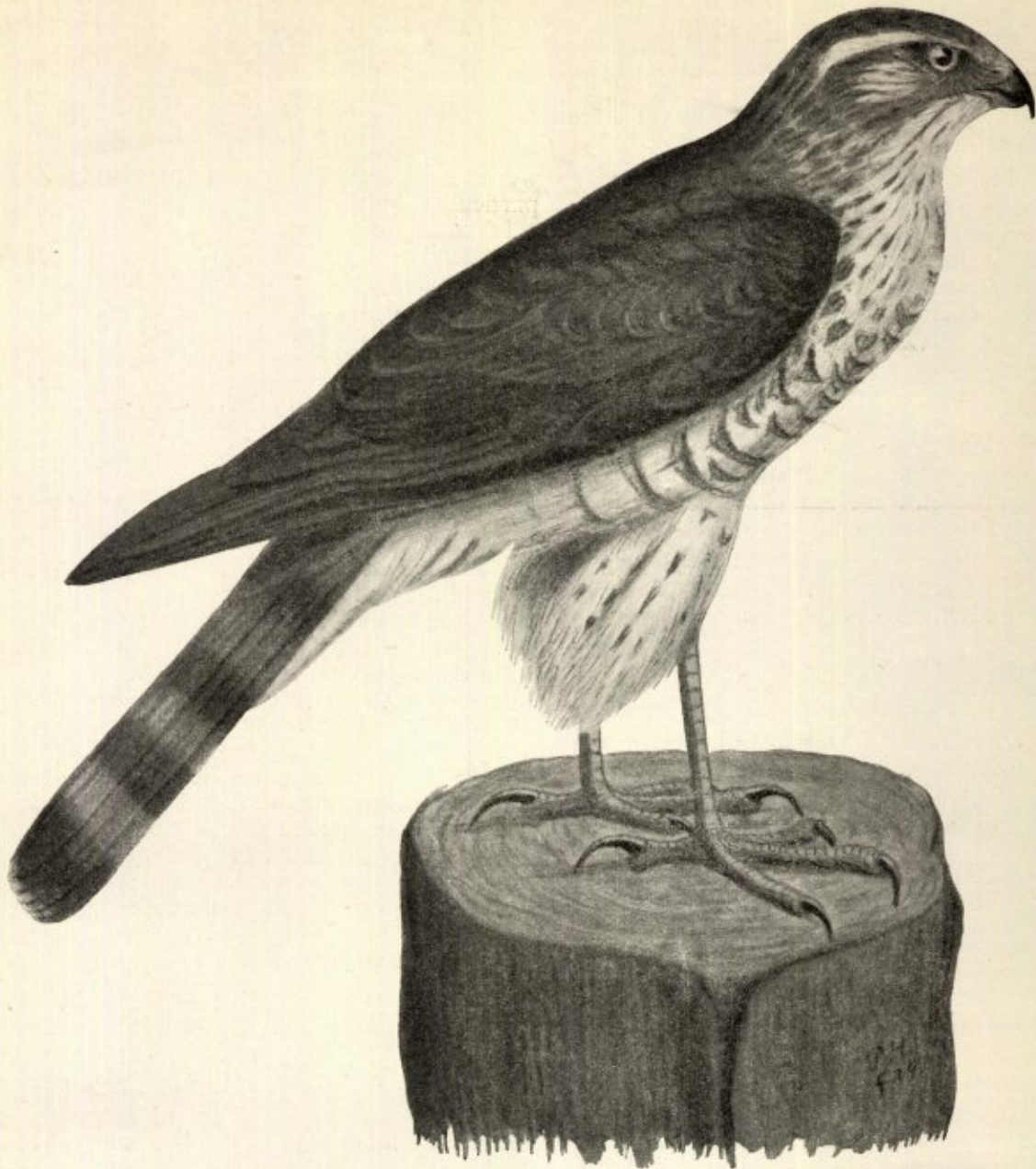
No. 133. Accipiter nisus peregrinoides Kleinschm. — Siberische Sperwer. ♂ 26 Oct. 1922, Heugem bij Maastricht. Coll. W. de Backer.

Eerst bekende exemplaar uit Nederland. — Zeldzame doortrekker.